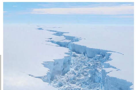
Il cambiamento climatico è uno dei temi trattati

to con quattrocento universitari del Politecnico di Torino. Prodotto da Rai per il Sociale e realizzato con la collaborazione del professor Francesco Profumo, presidente Fondazione per la Scuola della Compagnia di San Paolo, il programma, nato dagli incontri con gli studenti, è stato riadattato per la televisione. «Abbiamo filmato gli incontri, oltre agli interventi degli esperti, ci saranno schede per spiegare il contesto e la presentazione di un