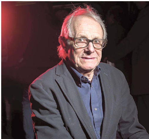
Sopra, il regista britannico Ken Loach. In alto, da sinistra, scene di "My name is Joe", film del 1998, "Il vento che accarezza l'erba", del 2006. In seconda fila, "Io, Daniel Blake", 2016, e "Sorry, We Missed You", 2019